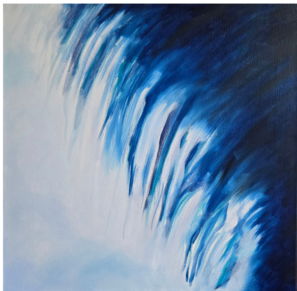
Szafirowa kaskada , olej, płótno, 50 × 50 cm, 2025