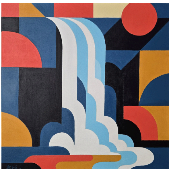
Konstrukcje przepływu – Przepływ I Zachód, akryl, płótno, 50 × 50 cm, 2025