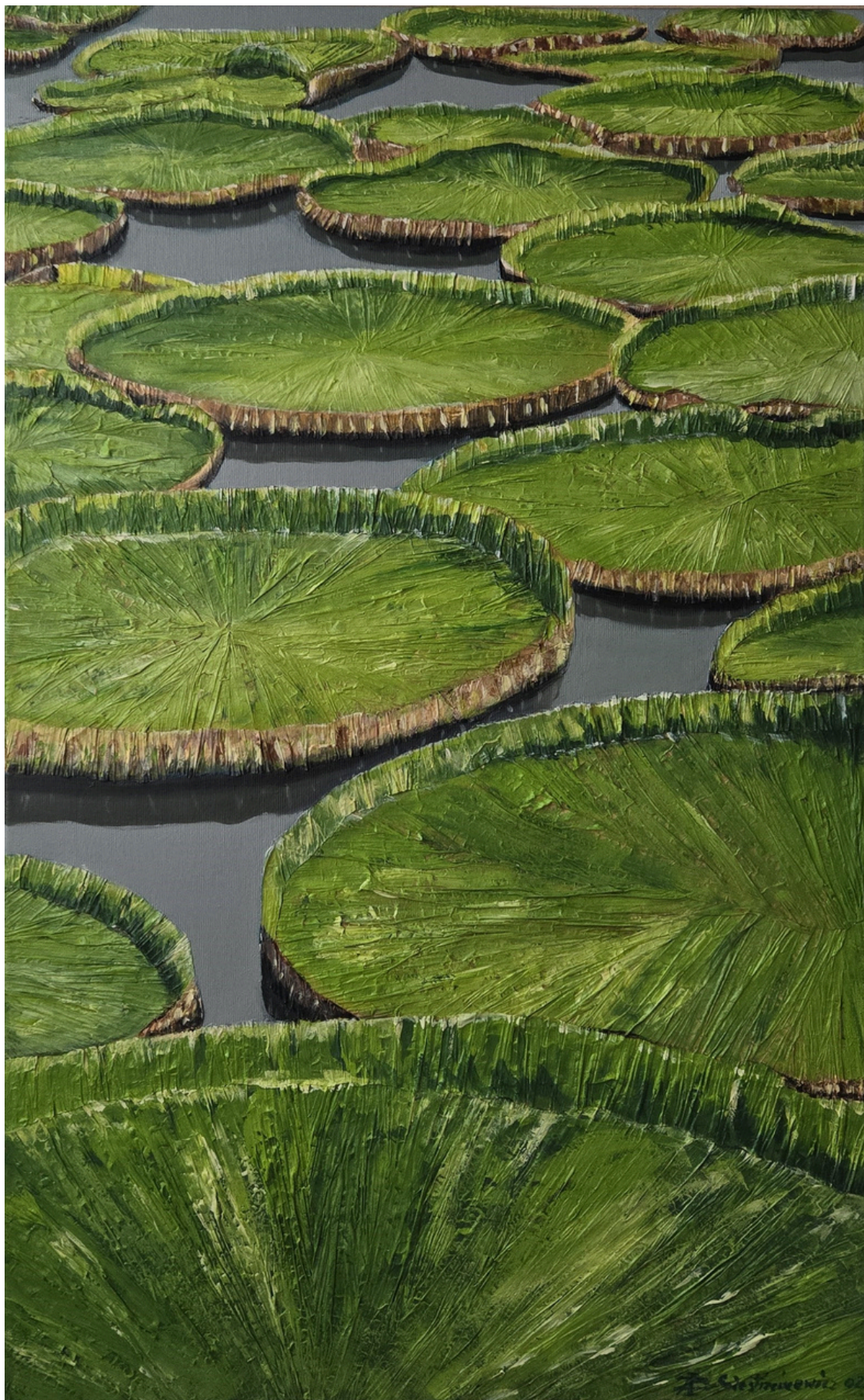
Victoria Regia / Zielone wyspy czasu, akryl, technika własna, płótno, 80 × 60 cm, 2026