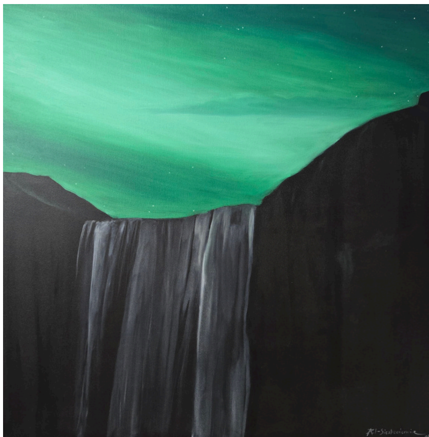
Skógafoss nokturn – emerald, olej, płótno, 80 × 80 cm, 2025