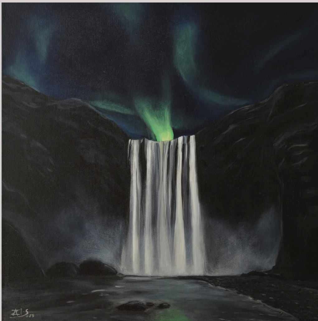
Noc, olej, płótno, 50 x 50 cm, 2025

E-mail: azi.sistrzencewicz@gmail.com Instagram: azi_sistrzencewicz_art