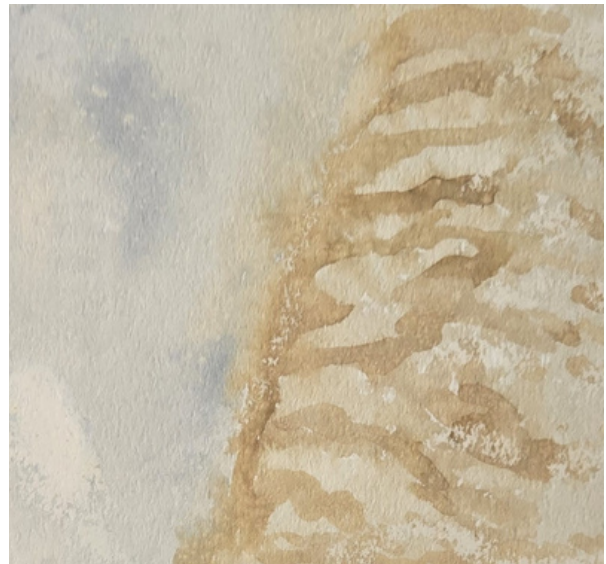
Cisza wody, barwniki naturalne, papier, 18 × 20 cm, 2023