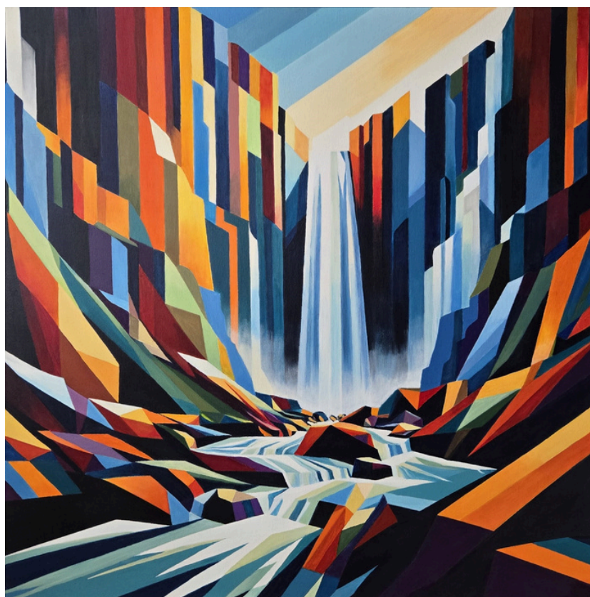
Szum, akryl, płótno, 80 × 80 cm, 2024