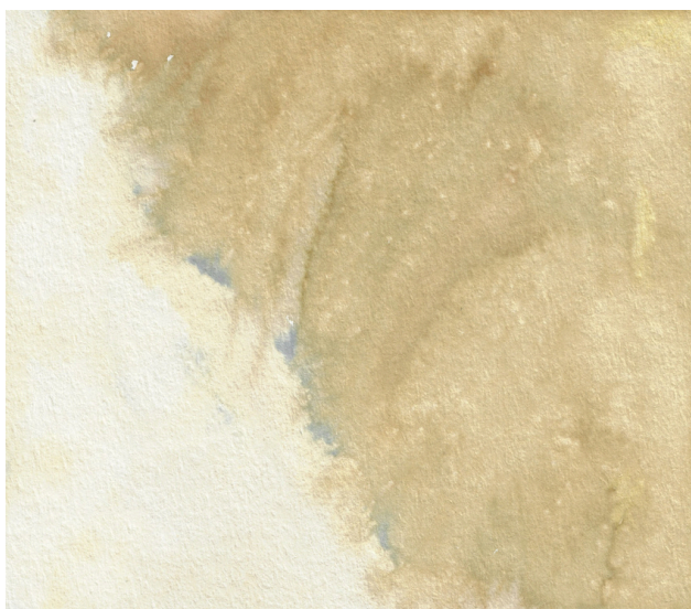
Tam, gdzie milknie czas, barwniki naturalne, papier, 18 × 20 cm, 2023