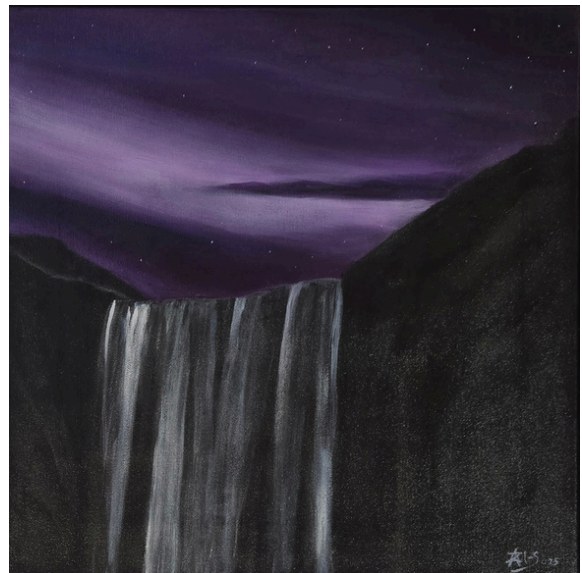
Skógafoss nokturn – fiolet , olej, płótno 40 × 40 cm, 2025