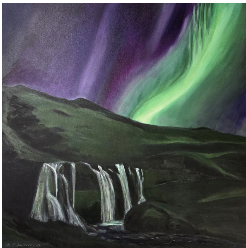
Zorza, olej, płótno 80 × 80 cm, 2025 Inspiracja fotografią Jasona Weingartha