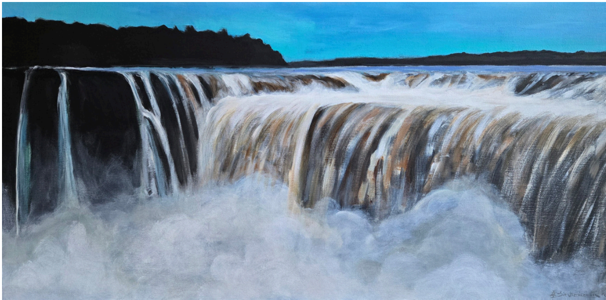
Iguazú II , akryl, płótno, 100 × 50 cm, 2025