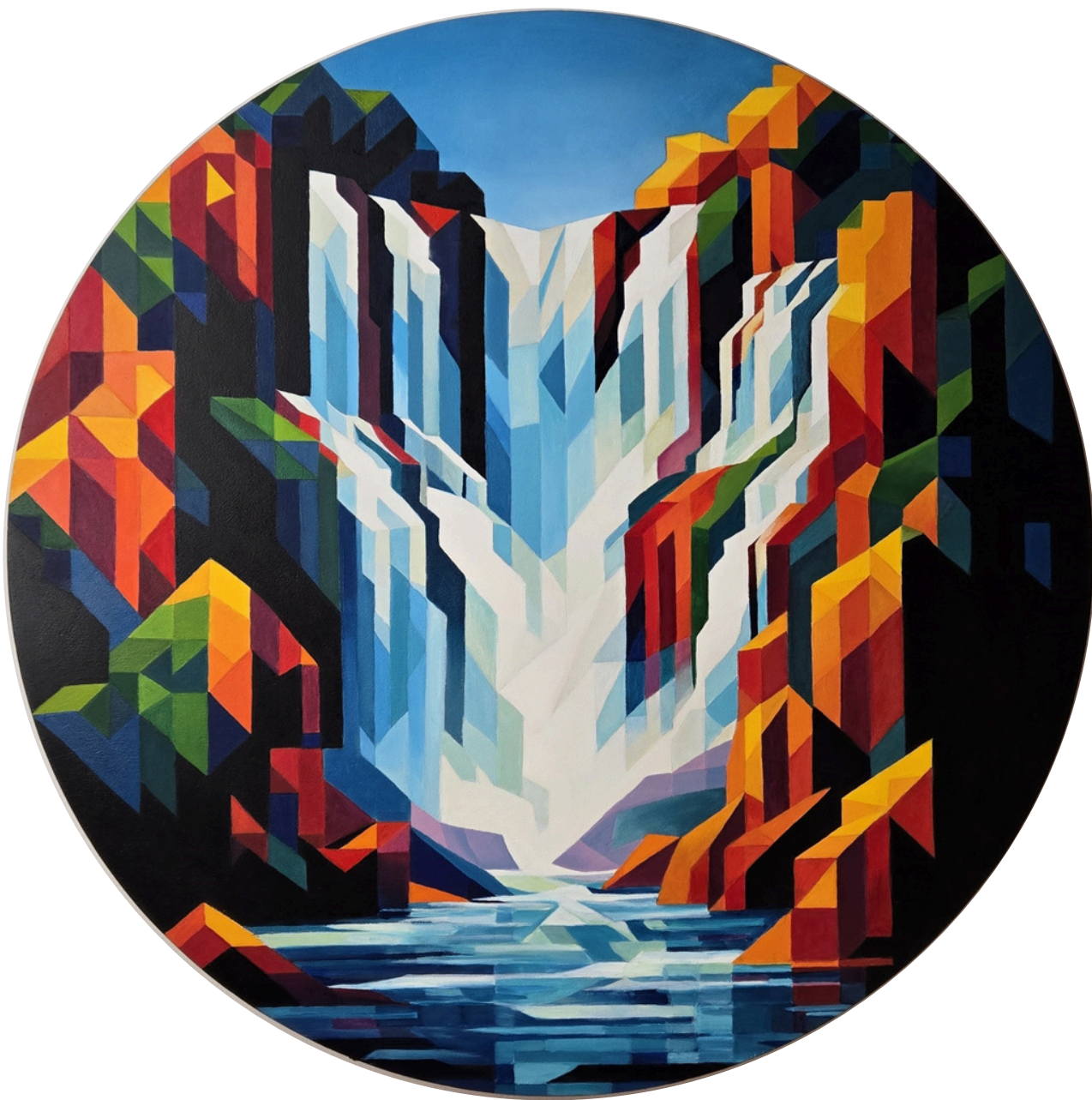
Geometryczny przepływ / Iguazú, olej, deska, tondo 80 cm, 2025