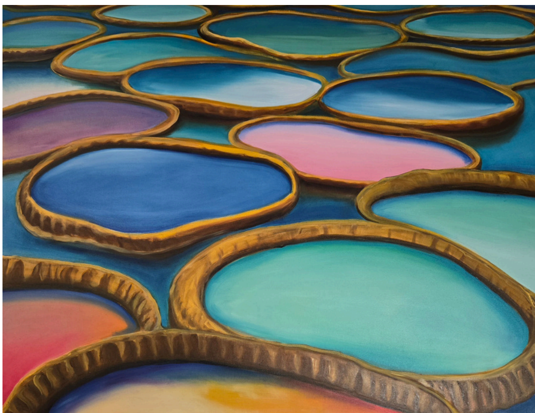
Archipelag koloru – Nenufary, olej, płótno, 116 × 90 cm, 2026