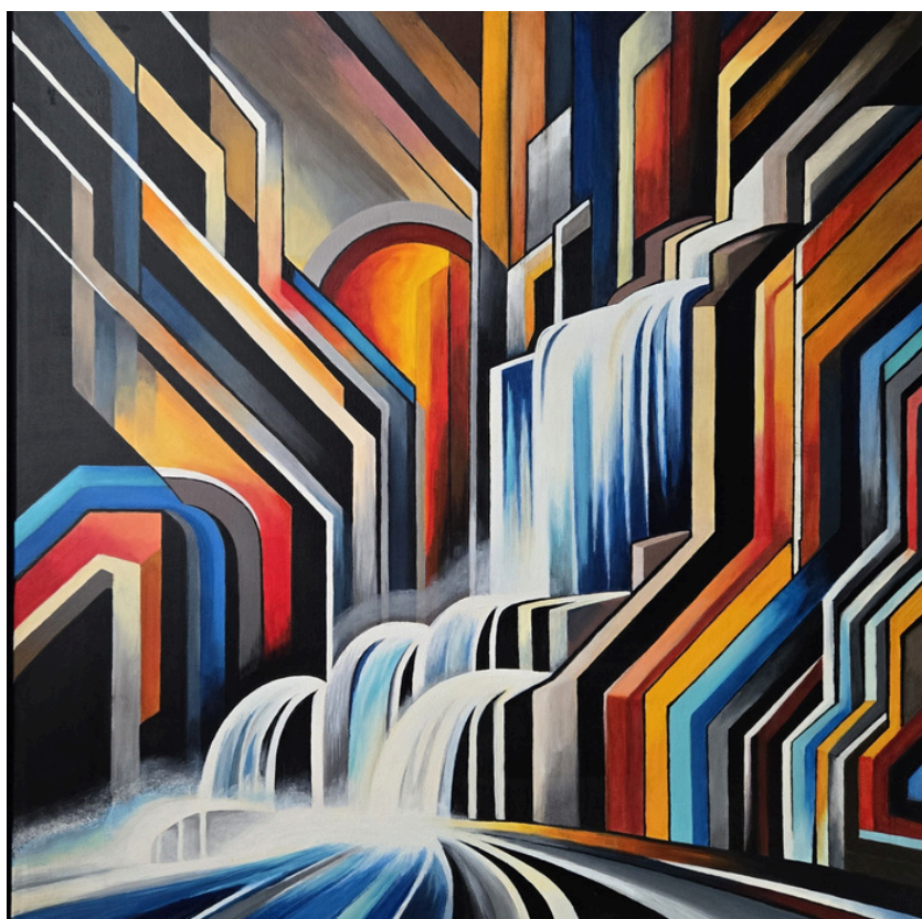
Iguazú, akryl, płótno, 80 × 80 cm, 2024