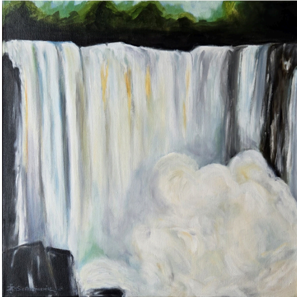
Świetlista kaskada , olej, płótno, 50 × 50 cm, 2025