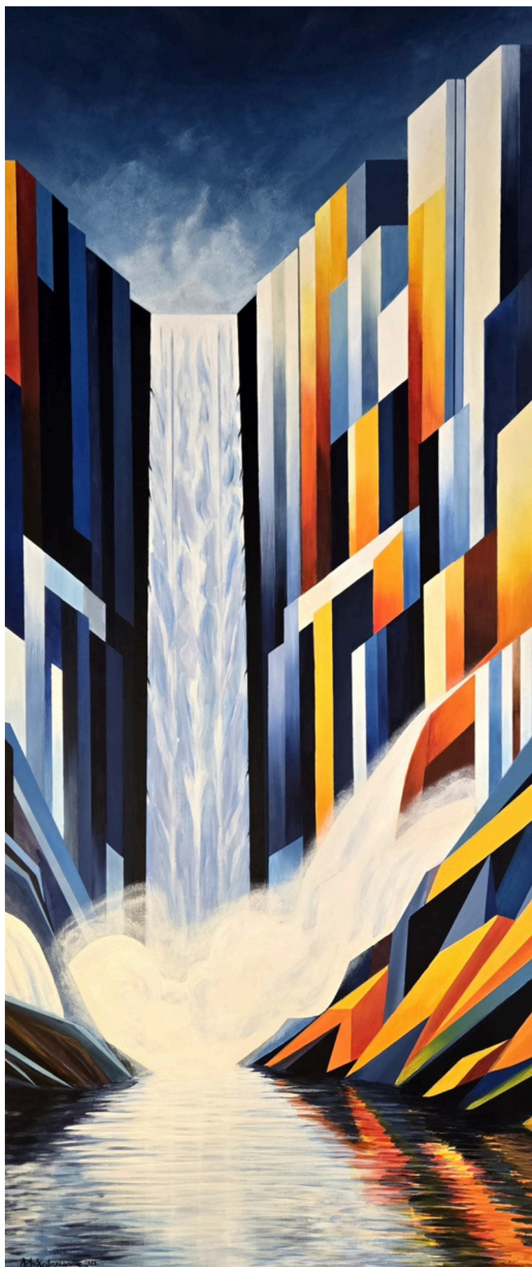
Pion , akryl, deska, 140 × 60 cm, 2026