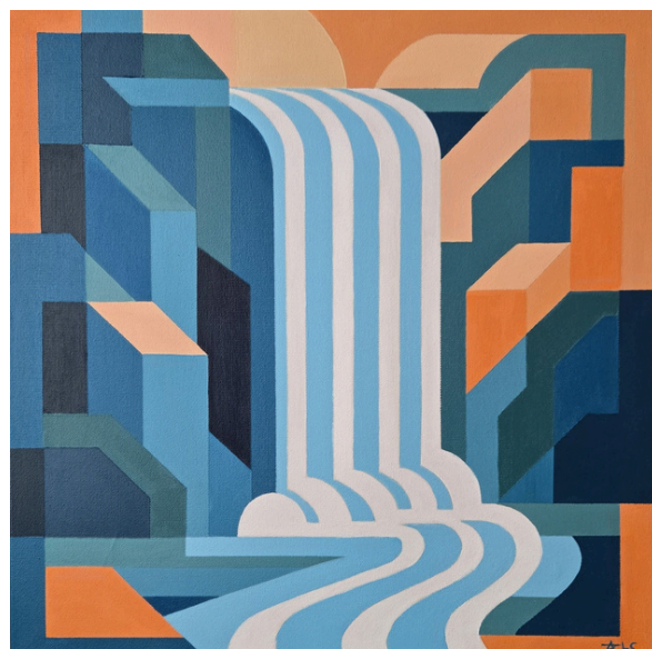
Konstrukcje przepływu – Przepływ II Struktura, akryl, płótno, 50 × 50 cm, 2026