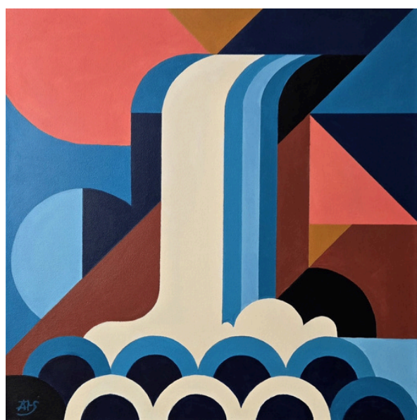
Konstrukcje przepływu – Przepływ III Energia, akryl, płótno, 50 × 50 cm, 2025