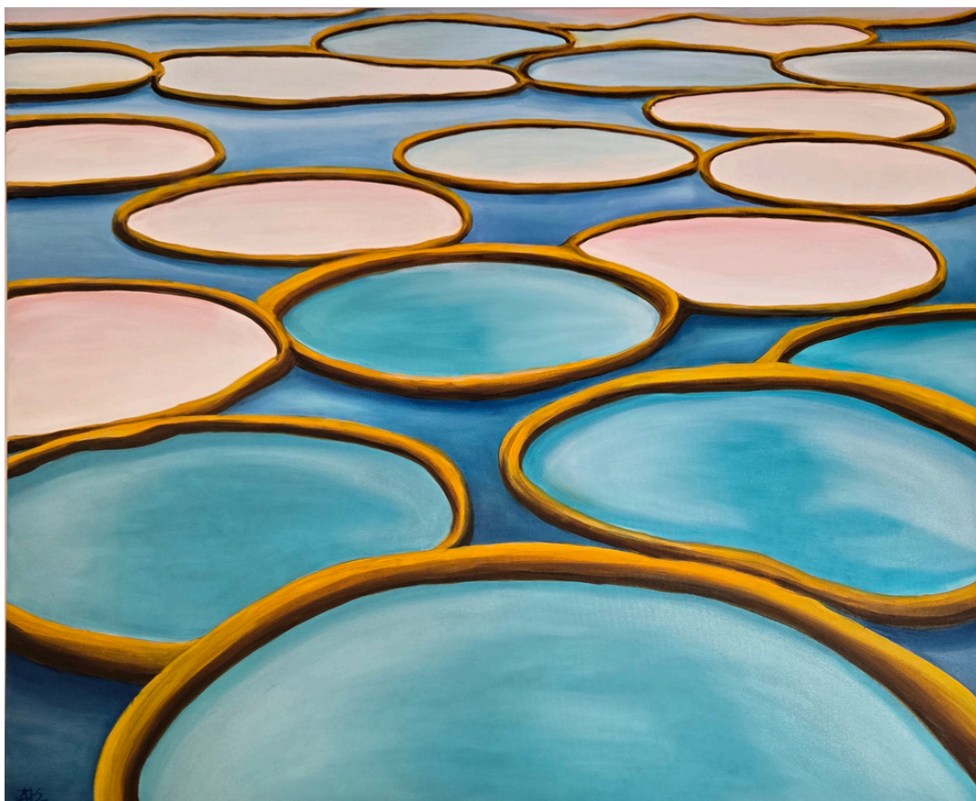
Archipelag ciszy – Nenufary, olej, płótno, 120 × 100 cm, 2026