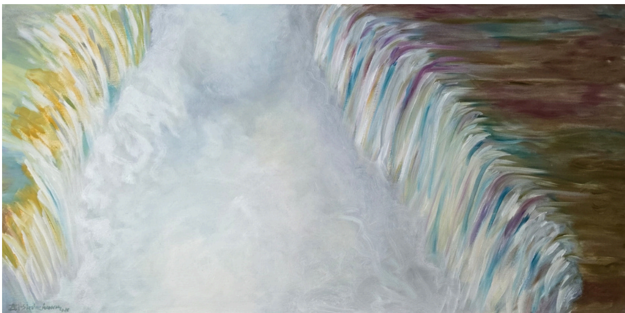
Rozproszenie , olej, płótno 100 × 50 cm, 2025